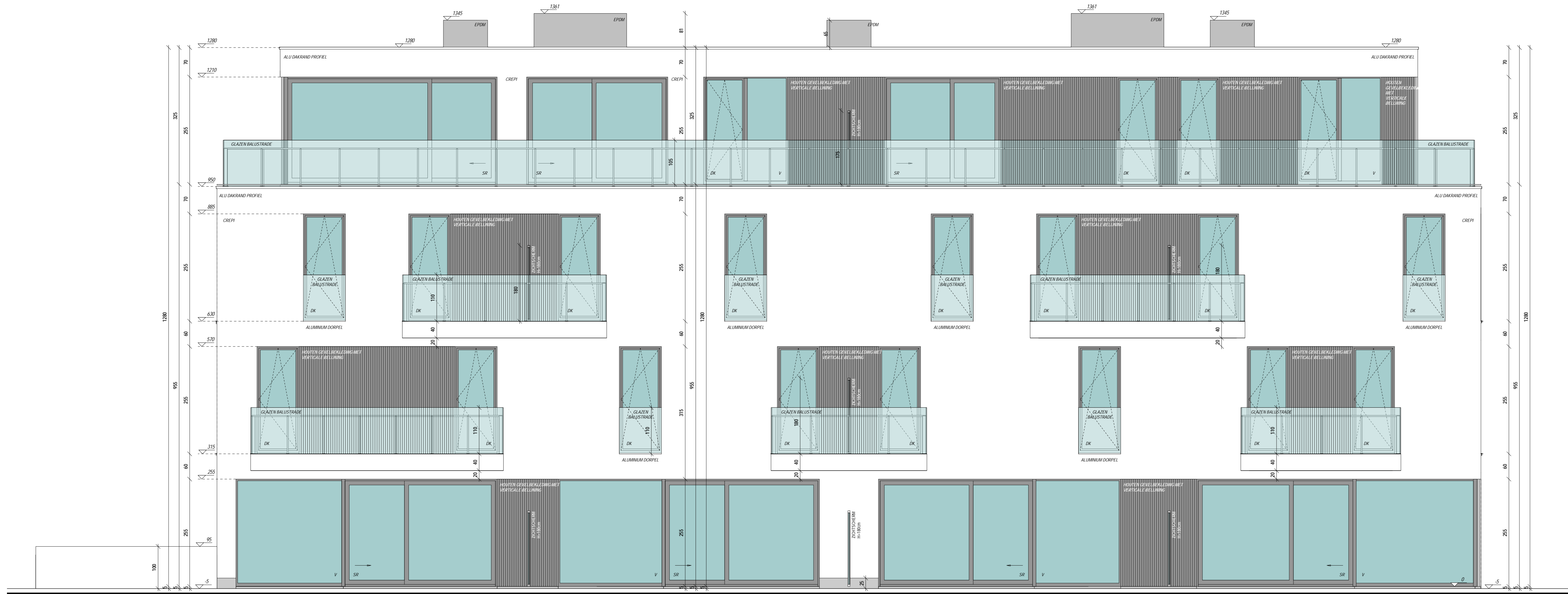
ACHTERGEVEL SCHAAL 1/50