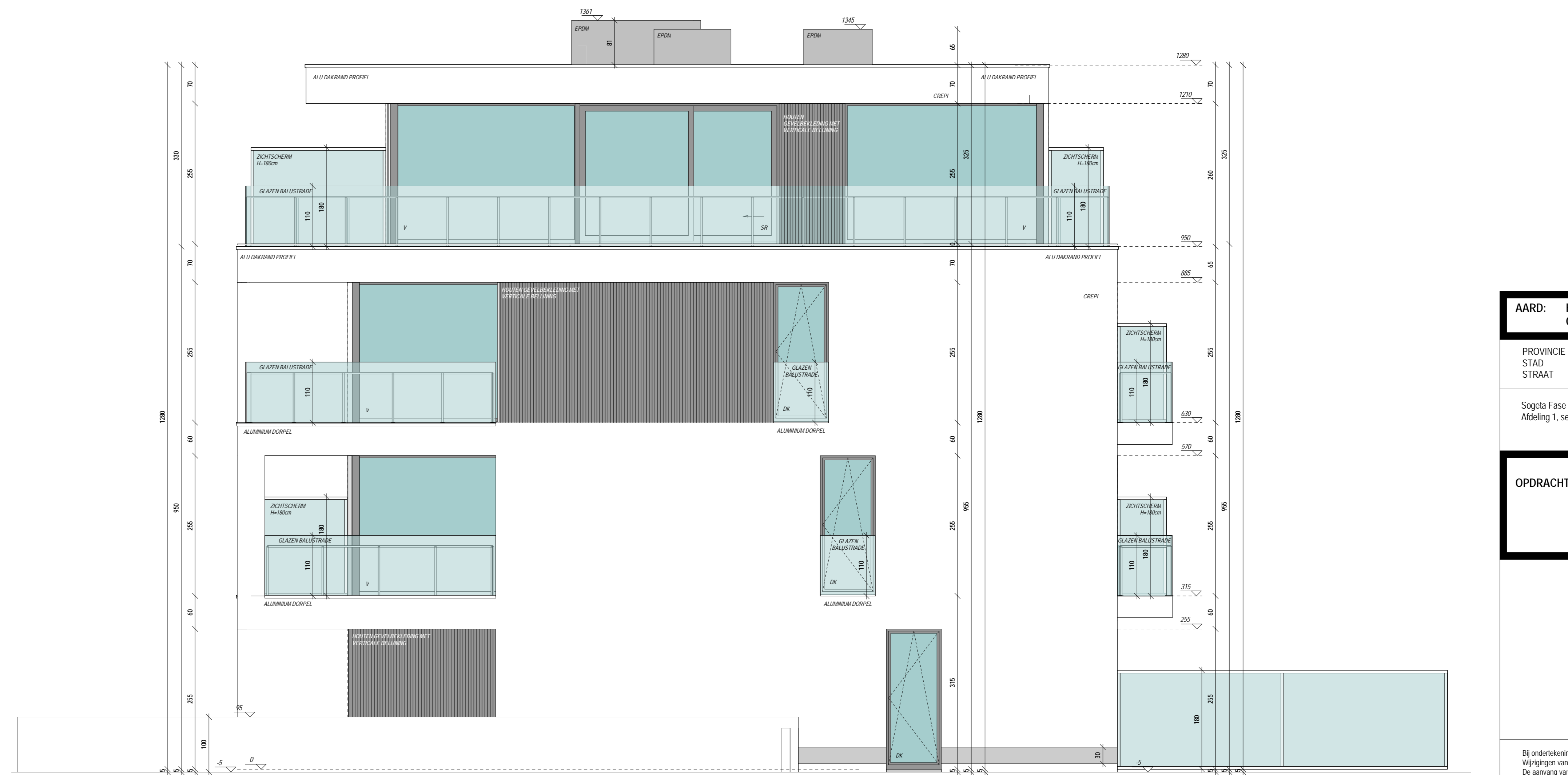
RECHTERZIJGEVEL SCHAAL 1/50