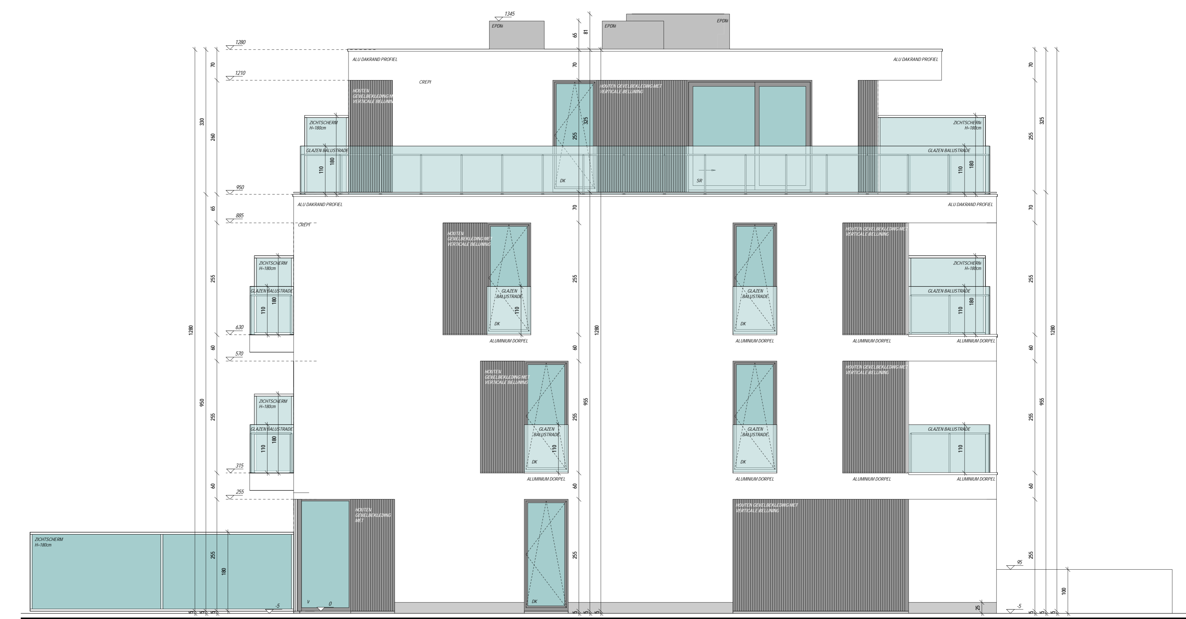
LINKERZIJGEVEL SCHAAL 1/50